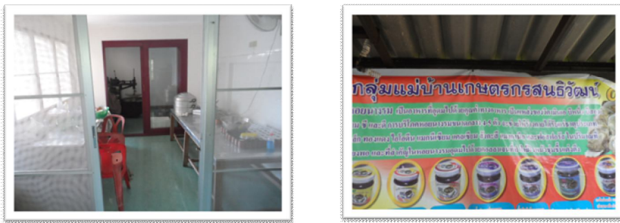
Figure 2 The production room and a brief description of the products