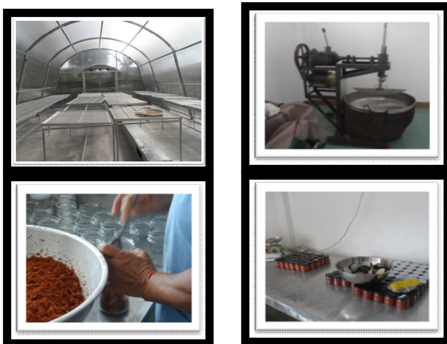
Figure 3 Materials of production process