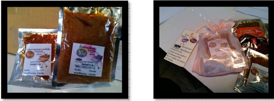
Figure 1 Examples of packaging products