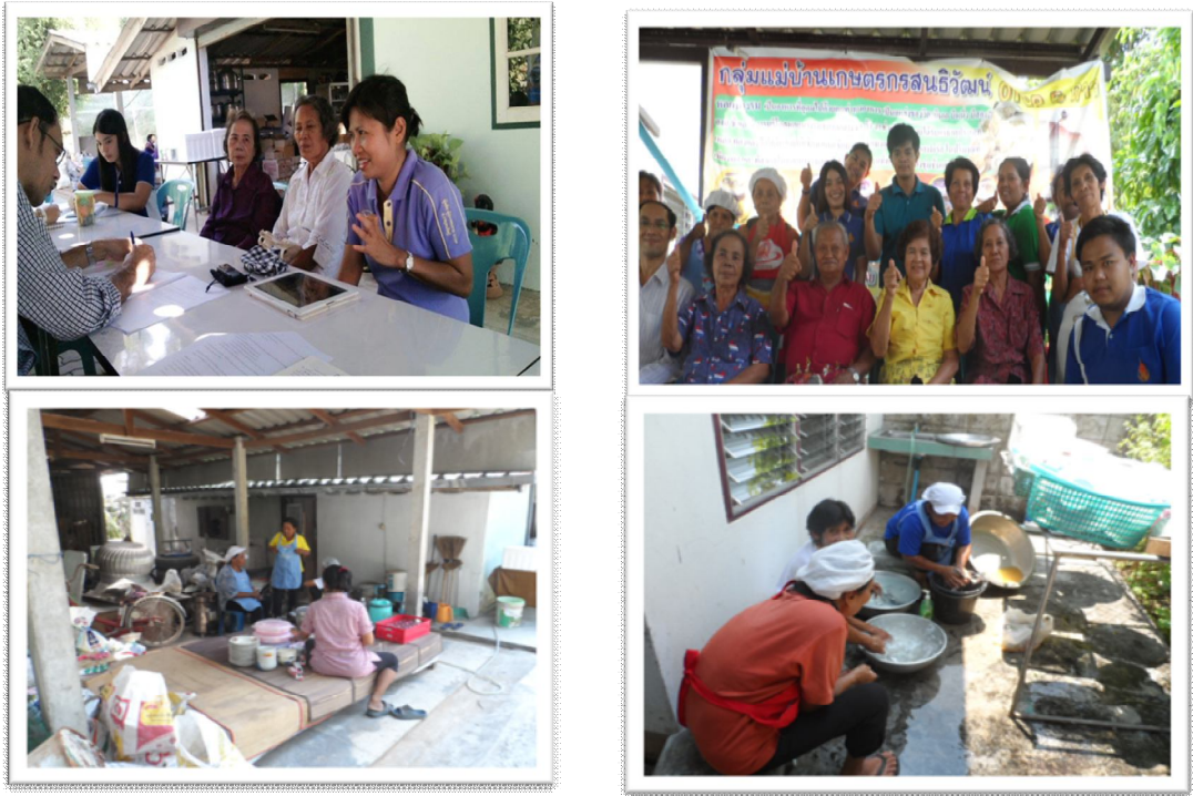
Figure 4 Focus group and in-depth interview

3) เตรียมวัสดุอุปกรณ์ ได้แก่ เครื่องบันทึกภาพและเสียง สมุดจดบันทึก กระดาษ ปากกา เป็นต้น 4) ประชุมเตรียมความพร้อม ชี้แจงวัตถุประสงค์และแนวทางการเก็บข้อมูลให้กับคณะวิจัยและผู้ช่วยวิจัย 5) ดำเนินการสัมภาษณ์และสนทนากลุ่มตามแนวคำถามเพื่อให้ได้ผลการศึกษารวมวัตถุประสงค์ที่ใช้ในการศึกษา