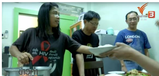
ภาพแสดงการรับประทานอาหารจากฝีมือผู้ติดเชื้อเอชไอวี

5. ฉาก (Setting) สื่อสาธารณะได้สร้างความหมายใหม่ผ่านฉากที่ปรากฏในรายการ เช่น การอยู่ร่วมกับกลุ่มผู้ติดเชื้อเอชไอวี การรับประทานอาหารร่วมกับกลุ่มผู้ติดเชื้อเอชไอวี และการรับประทานอาหารจากฝีมือผู้ติดเชื้อเอชไอวี ซึ่งเป็นความพยายามสร้างทัศนคติเชิงบวกต่อผู้รับสาร กลุ่มผู้ติดเชื้อเอชไอวีกลายเป็นเหยื่อของสังคมโดยกีดกันให้บุคคลเหล่านี้กลายเป็นคนอื่น จึงทำให้มีสภาพความเป็นอยู่ที่ขัดสนไม่เหมือนกับคนปกติทั่วไป เช่น สภาพที่อยู่อาศัย การอยู่ร่วมกันของกลุ่มผู้ติดเชื้อที่ตัดสินใจตัดขาดจากโลกภายนอกดังแสดงในภาพ ดังนี้