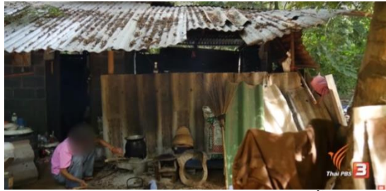
ภาพแสดงสภาพความเป็นอยู่ของกลุ่มผู้ติดเชื้อเอชไอวี/ผู้ป่วยเอดส์ (เทปรายการแพะ เดอะซีรีส์: เป็นเอดส์ก็เป็นคน, 2560)

จากผลการศึกษาพบว่าสื่อสาธารณะได้พยายามสร้างและนำเสนอความหมายใหม่เกี่ยวกับผู้ติดเชื้อเอชไอวีให้กับสังคมได้รู้ว่าผู้ติดเชื้อเอชไอวีไม่ได้เป็นกลุ่มคนที่สิ้นหวังรอความตายและมีสภาพร่างกายสุขภาพอ่อนแอเหมือนที่ทัศนคติและอคติที่สังคมมีต่อกลุ่มคนเหล่านี้ ปัจจุบันเมื่อผู้ติดเชื้อเอชไอวีได้เข้าสู่กระบวนการรักษาที่ถูกต้องก็สามารถกลับมาใช้ชีวิตและมีคุณภาพชีวิตได้อย่างปกติและผู้ติดเชื้อเอชไอวีสามารถกลับมาใช้ชีวิตได้อย่างปกติไม่ว่าจะเป็นการเรียน การประกอบอาชีพตลอดจนการมีครอบครัวได้เหมือนกับคนทั่วไป